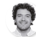
Joshua Thiele Bauakademie GmbH