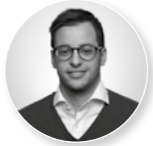
Sipho Fuhr BAUAKADEMIE GmbH