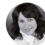
Liana-Heike Kuban Robert Bosch GmbH