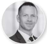
Ralph Struck Flughafen Berlin Branden- burg GmbH